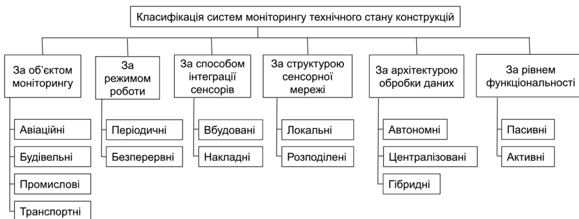
Рис. 2. Класифікація систем моніторингу

Класифікація систем моніторингу технічного стану конструкцій представлена на рис. 2.